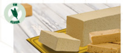
BLOQUE TURRÓN (1) Ref: 00255 1L