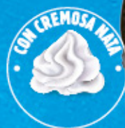
CORNETTO GO! Ref.: 64101 33 ud./caja-110 ml · 66 g