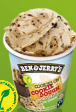
Ref: 37491 8 ud./caja - 465ml - 406g Caramelo con cookies y trocitos de chocolate.