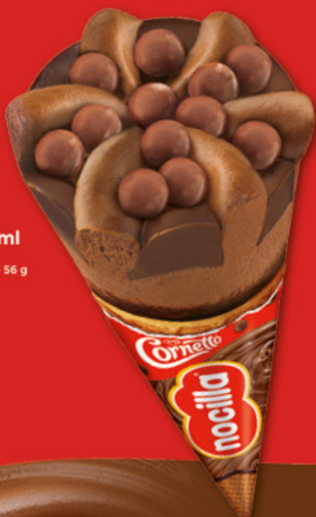
Cono Nocilla 90ml Ref.: 49524 30 ud./caja-90 ml · 56 g