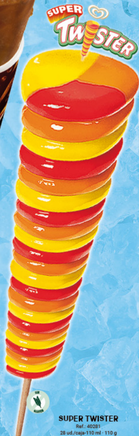
SUPER TWISTER Ref.: 40281 28 ud./caja-110 ml · 110 g