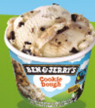
Ref: 71522 12 ud./caja - 100ml - 72g Vainilla con cookies y trocitos al chocolate.