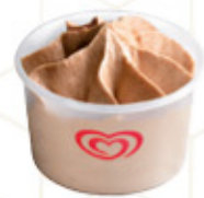
SABOR TURRÓN Ref.: 90858 - 120ml