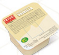
SABOR VAINILLA (1) Ref.: 000439 70ml