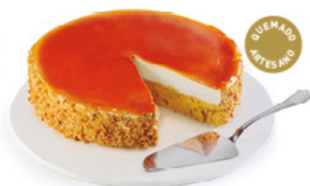
TARTA AL WHISKY Y QUEMADO ARTESANO Ref.: 62072 1,5L

Tradición, experiencia, dedicación y esfuerzo son los ingredientes principales de nuestra gama de repostería.