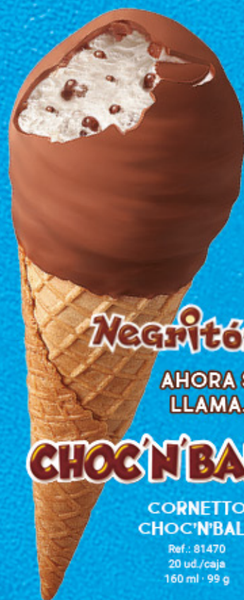
Negritón AHORA SE LLAMA... CHOC'N'BALL