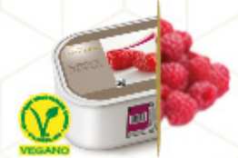
FRAMBUESA Con trocitos de frambuesa Ref: 39945 2,4L - 1560g