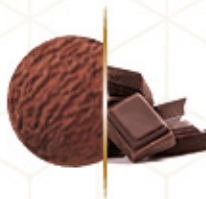
GRANEL FRIGO CHOCOLATE Ref: 02075 5L