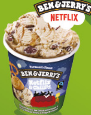
Ref: 38636 8 ud./caja - 465ml - 405g Sabor crema de cacahuete con salsa dulce de galletas saladas y trocitos de brownie.