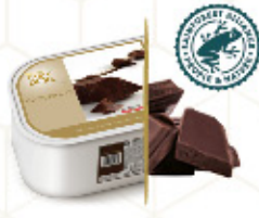
CHOCOLATE NEGRO CON CACAO DE ECUADOR Con chocolate del 70% Ref: 77711 2,4L - 1200g