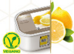
LIMÓN Con limones de Sicilia Ref: 97631 2,4L - 1560g