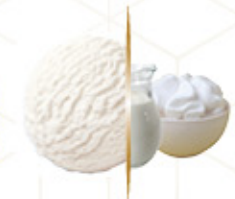
GRANEL FRIGO NATA Ref: 38100 5L