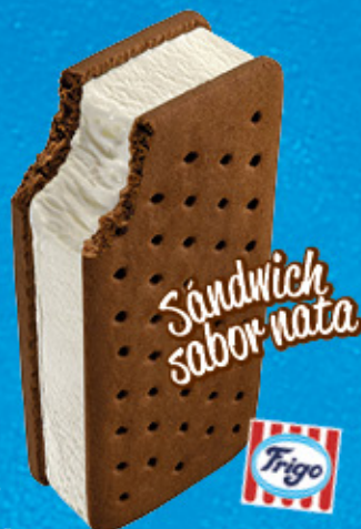
SÁNDWICH SABOR NATA Ref.: 00215 42 ud./caja-100 ml · 67 g