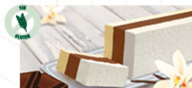
BLOQUE TRES GUSTOS (1) Ref: 00254 1L