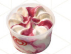
SABOR VAINILLA-FRAMBUESA Ref.: 84547 - 120ml

Con salsas y toppings, listas para servir y con menos de 150kcal.