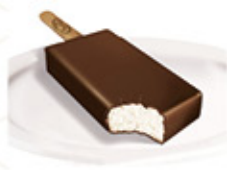
BOMBÓN Ref.: 61927 100ml