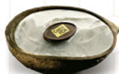
COCO HELADO Ref.: 86864 150ml