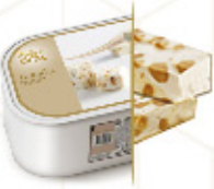
TURRÓN DURO Helado crema de turrón con trocitos de turrón duro Ref: 97702 2,4L - 1200g