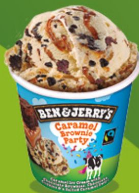
Ref: 37435 8 ud./caja - 465ml - 405g Caramelo con salsa de caramelo a la sal, brownies de chocolate y galleta de chocolate.