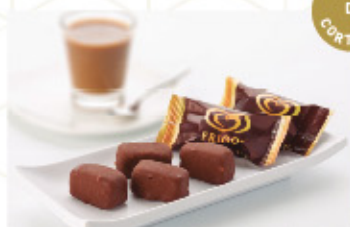
FRIGO MOMENTS Ref.: 63492 120 unidades de 12ml