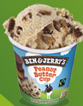
Ref: 37452 8 ud./caja - 465ml - 425g Crema de cacahuete con tartaletas al cacao rellenas de crema de cacahuete.