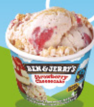
Ref: 71515 12 ud./caja - 100ml - 72g Sabor tarta de queso con fresas y cookies.