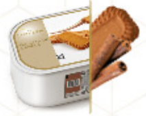
GALLETAS SPÉCULOOS Cremoso helado sabor galleta con trocitos de galleta de canela Ref: 71710 2,4L - 1200g