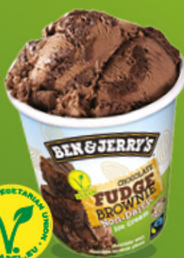
Ref: 37373 8 ud./caja - 465ml - 382g Chocolate con trocitos de brownie.