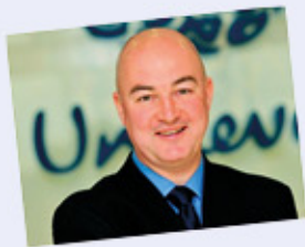
Alan Jope, CEO Unilever

La Agenda 2030 con los OBJETIVOS DE DESARROLLO SOSTENIBLE y el CAMBIO CLIMÁTICO están marcando el futuro de la SOSTENIBILIDAD , a la vez que el PROPÓSITO se ha convertido en la BRÚJULA que guía nuestro negocio a través de nuestras marcas.