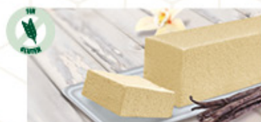
BLOQUE SABOR VAINILLA (1) Ref: 00251 1L