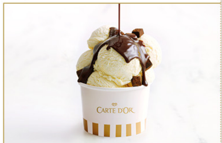
COPA DE HELADO DE VAINILLA CARTE D'OR CON SIROPE CRUNCHY DE CHOCOLATE