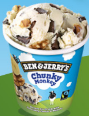
Ref: 37296 8 ud./caja - 465ml - 419 g Sabor plátano con trozos chocolateados y nueces.