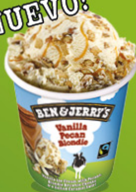
Ref: 37426 8 ud./caja - 465ml - 414g Helado crema de vainilla con salsa de caramelo con toque de sal, nueces de pecán caramelizadas y trocitos de brownie.