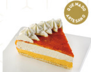
TARTA AL WHISKY CON ROSETAS Ref.: 62074 2L