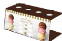
Portaconos Ref.: 41476