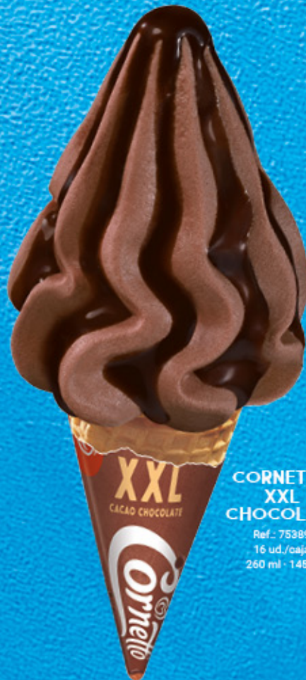
CORNETTO XXL CHOCOLATE Ref.: 75389 16 ud./caja 260 ml · 145 g