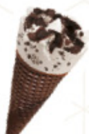
CONO COOKIES (1) Ref.: 00516 110ml