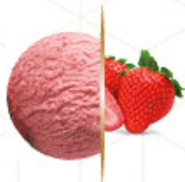
GRANEL FRIGO FRESA Ref: 03241 5L