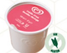
SABOR VAINILLA-FRESA Ref.: 74429 - 120ml VEGANO