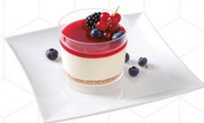
COPA DELICIA CHEESECAKE Ref.: 86817 150ml