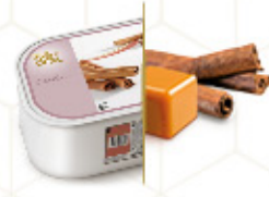
CANELA CON CRUJIENTES DE CARAMELO Helado crema de canela con trocitos de caramelo crujiente Ref: 97563 2,4L 1200g