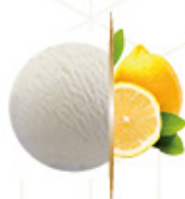
GRANEL FRIGO LIMÓN Ref: 38660 5L