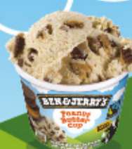
Ref: 77540 12 ud./caja - 100ml - 72g Crema de cacahuete con tartaletas al cacao rellenas de crema de cacahuete.