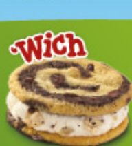
Ref: 85396 20 ud./caja - 80ml - 65g Vainilla con trozos de galleta entre dos galletas con trocitos de chocolate.