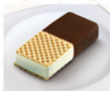
DOMINÓ Ref.: 12159 90ml