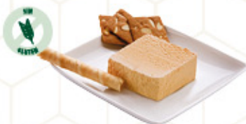
BLOQUE TURRÓN SELECTO (1) Ref: 00256 1L