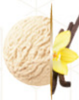
GRANEL FRIGO VAINILLA Ref: 39580 5L