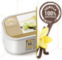
VAINILLA DE MADAGASCAR Con vainas de vainilla Ref: 97775 2,4L - 1200g

Garantizamos ingredientes sostenibles en nuestros principales sabores.