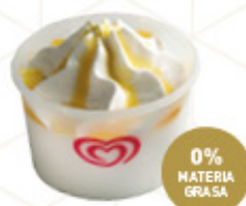
SORBETE LIMÓN Ref.: 90293 - 120ml 0% MATERIA GRASA