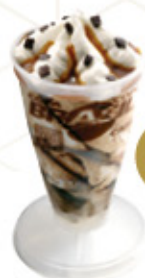
COPA BRASIL Ref.: 94295 125ml