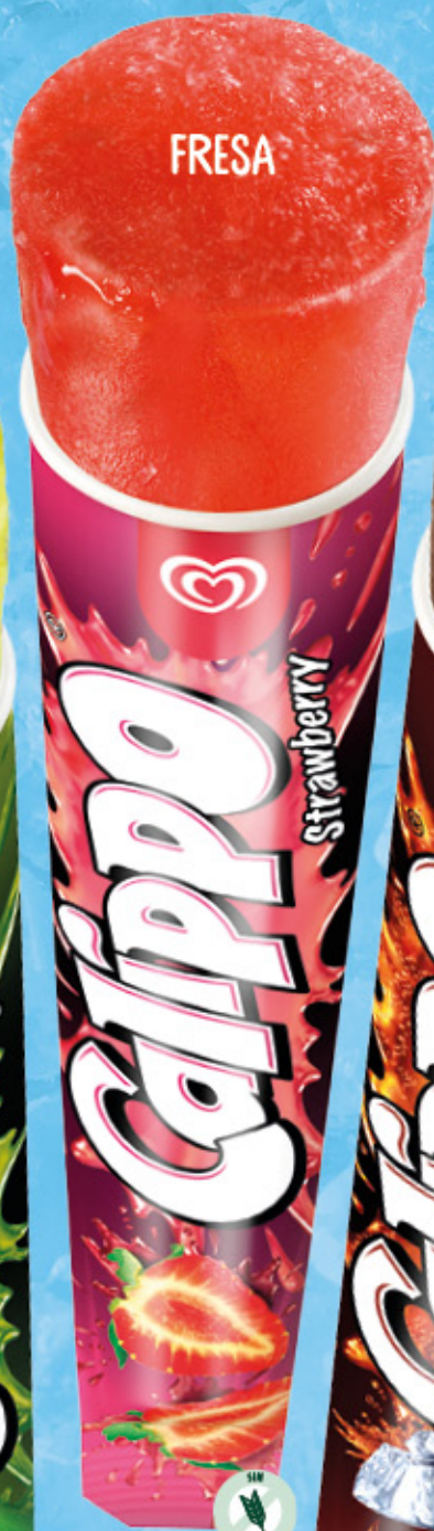
CALIPPO FRESA Ref.: 40134 24 ud./caja-105 ml · 105 g