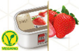
FRESA Con trocitos de fresas Ref: 97752 2,4L - 1560g