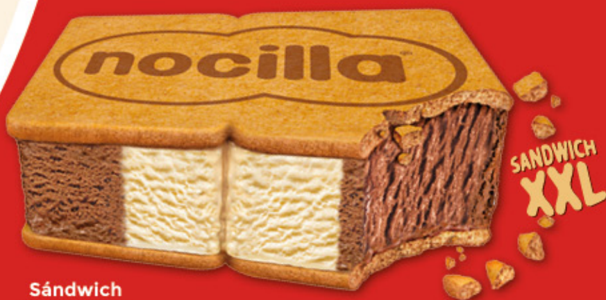
Sándwich Nocilla XXL Ref.: 49519 36 ud./caja-140 ml · 79 g