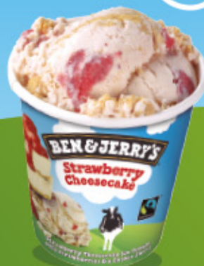
Ref: 37413 8 ud./caja - 465ml - 416g Sabor tarta de queso con fresas y cookies.