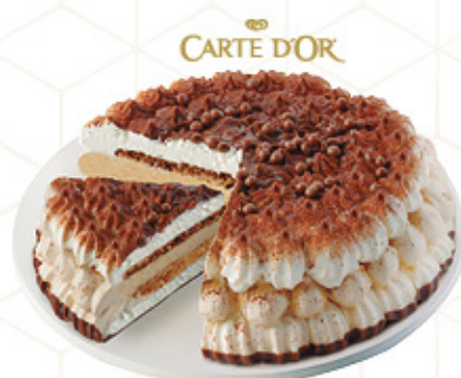
ROMÁNTICA Ref.: 62016 2L