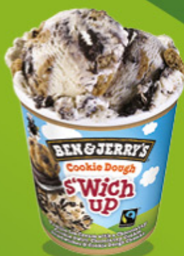
Ref: 37189 8 ud./caja - 465ml - 404g Vainilla con galletas al cacao rellenas de crema, trocitos de galleta con chocolate y salsa de galleta al cacao.