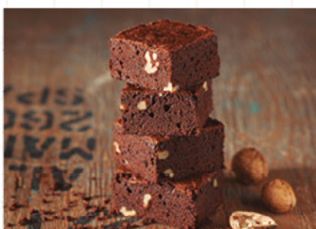
BROWNIE CON NUECES (2)