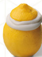
LIMÓN HELADO Ref.: 94293 125ml