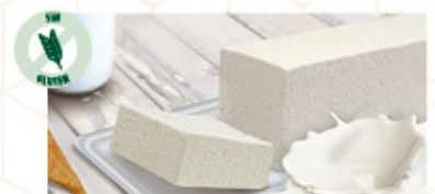
BLOQUE SABOR NATA (1) Ref: 00252 1L