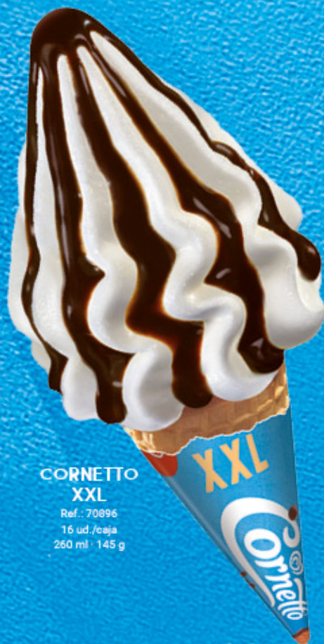
CORNETTO XXL Ref.: 70896 16 ud./caja 260 ml · 145 g