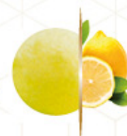
GRANEL FRIGO SORBETE LIMÓN Ref: 94283 5L