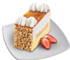
TARTA AL WHISKY RECTANGULAR Ref.: 31342 1,8L