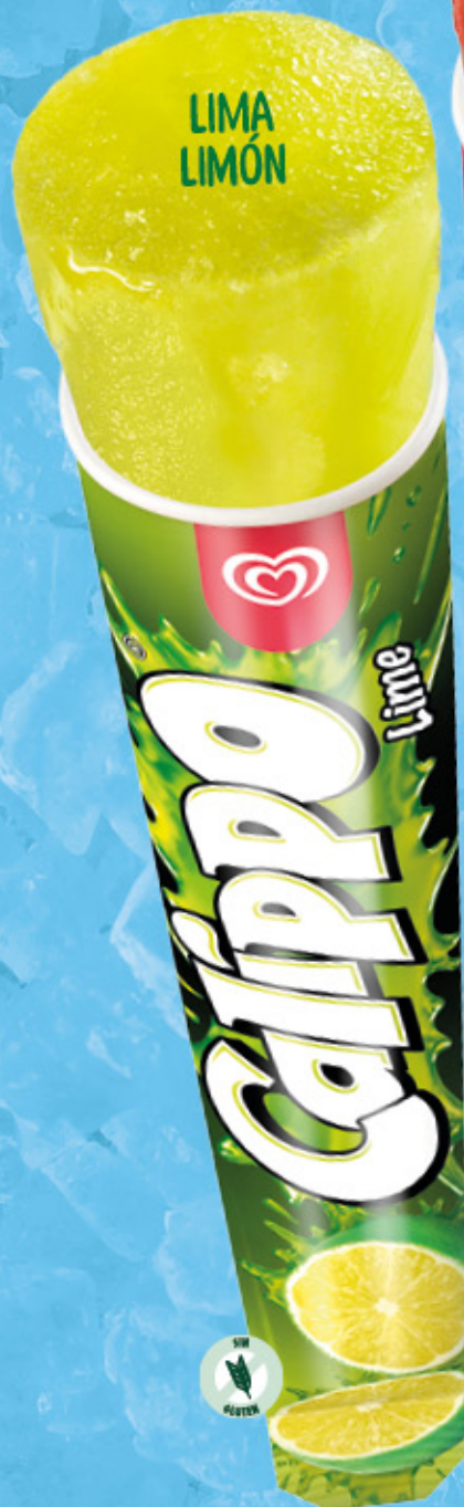
CALIPPO LIMA-LIMÓN Ref.: 40118 24 ud./caja-105 ml · 105 g

¡DISFRUTA DEL VERANO CON NUESTROS HELADOS MÁS REFRESCANTES!