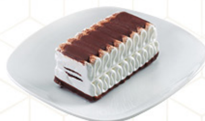
MINI COMTESSA Ref.: 32495 125ml