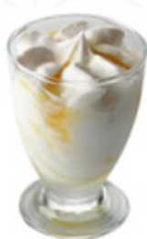
CITRUS LIMÓN Ref.: 70864 180ml