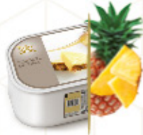
PIÑA TROPICAL Con trocitos de piña Ref: 97549 2,4L - 1560g