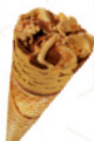
CONO TURRÓN (1) Ref.: 00515 110ml