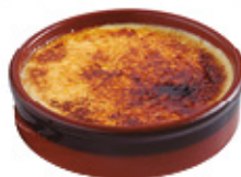
CREMA CATALANA Ref.: 62749 150ml