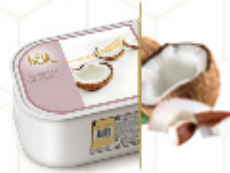
COCO Con coco rallado Ref: 97635 2,4L - 1200g