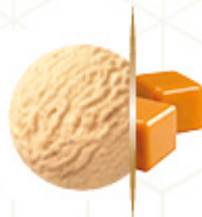
GRANEL FRIGO CARAMELO Ref: 38110 5L