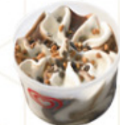
SABOR VAINILLA-CHOCOLATE Ref.: 81548 - 120ml