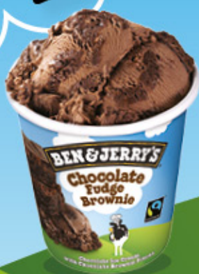
Ref: 37071 8 ud./caja - 465ml - 408g Chocolate con trocitos de brownie.