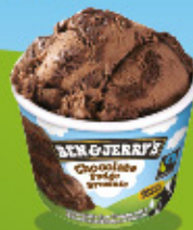
Ref: 71520 12 ud./caja - 100ml - 72g Chocolate con trocitos de brownie.