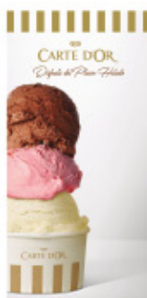
Cartel exterior Carte d'Or Ref.: 41591