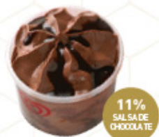
SABOR 2 CHOCOLATES Ref.: 82556 - 120ml 11% SALSA DE CHOCOLATE