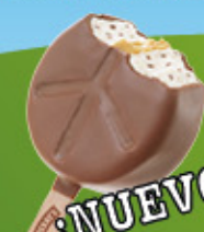
Ref: 40320 20 ud./caja - 80ml - 69g Helado de vainilla con trocitos de chocolate con un centro de pasta de galletas y recubrimiento de cacao.