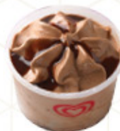
SABOR CAFÉ Ref.: 82555 - 120ml