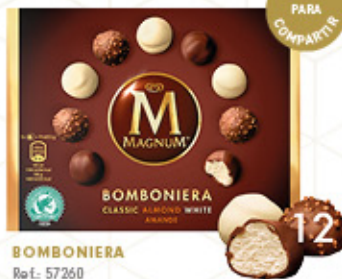
BOMBONIERA Ref.: 57260 12 packs de 140ml