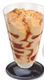
COPA TURRÓN SELECTO (1) Ref.: 00500 180ml