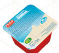
SABOR VAINILLA SIN AZÚCAR (1) Ref.: 000438 70ml