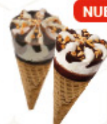
MINI CONOS (1) Ref.: 00530 28ml