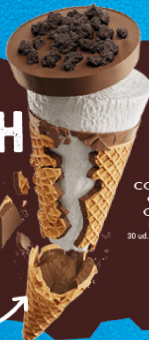
CORNETTO CRUSH COOKIE Ref.: 40616 30 ud./caja-90 ml · 60 g