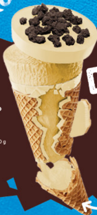
CORNETTO CRUSH BLANCO Ref.: 41149 30 ud./caja-90 ml · 60 g