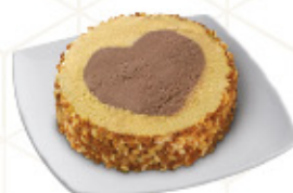
BARRA CROCANTI Ref.: 00451 1L