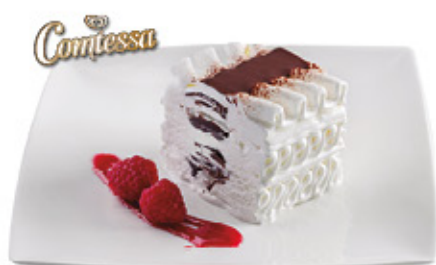
COMESSA CLÁSICA Ref.: 32314 1L