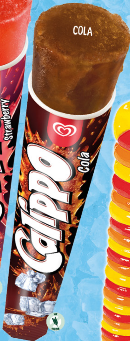
CALIPPO COLA Ref.: 46124 24 ud./caja-105 ml · 105 g