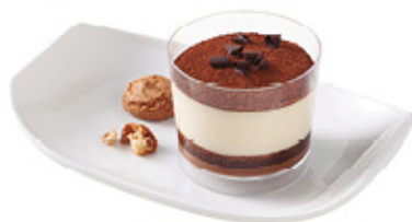
COPA DELICIA TIRAMISÚ Ref.: 86864 150ml