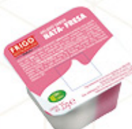
SABOR NATA-FRESA (1) Ref.: 000441 70ml