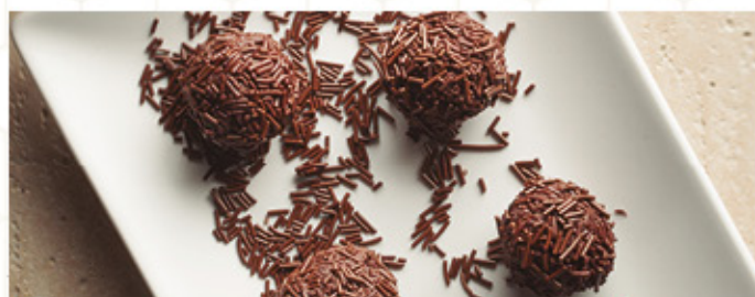
TRUFAS DE CHOCOLATE (2)