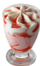
FRAGOLA FRESCA Ref.: 70956 180ml