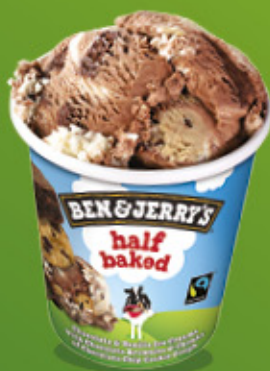
Ref: 37103 8 ud./caja - 465ml - 406g Chocolate y vainilla con trocitos de brownie y galletas con pepitas de chocolate.