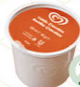
SABOR VAINILLA-CHOCOLATE Ref.: 74427 - 120ml VEGANO