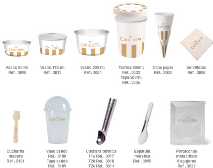
Vasito 80 ml Ref.: 3098