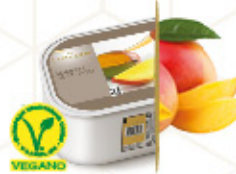
MANGO Con mango de la India Ref: 39805 2,4L - 1560g