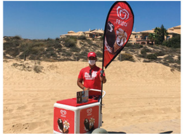
Proyecto Playas Limpias

Mejorar la calidad de vida de millones de personas 100% de las materias primas procedan de fuentes sostenibles