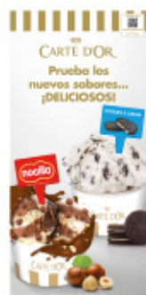
Cartel Novedades Carte d'Or Ref.: 41639