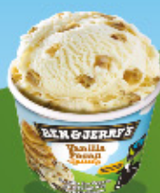
Ref: 32212 12 ud./caja - 100ml - 76g Crema de vainilla con trocitos de nueces de pecán caramelizadas.