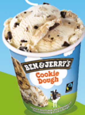
Ref: 37311 8 ud./caja - 465ml - 406g Vainilla con cookies y trocitos al chocolate.