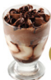
DÚO VAINILLA Y CHOCOLATE Ref.: 70863 180ml