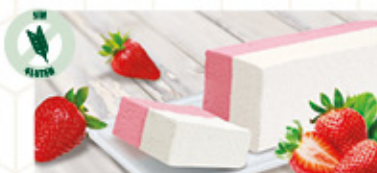
BLOQUE SABOR NATA FRESA (1) Ref: 00253 1L