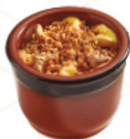
TARRINA CROCANTI Ref.: 62059 140ml