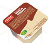
SABOR VAINILLA-CHOCOLATE (1) Ref.: 000440 70ml