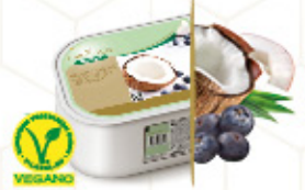
COCO & ARÁNDANOS Coco con salsa de arándanos Ref: 40542 2,4L - 1400g